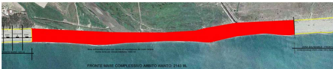
Figura 3 - Area sottoposta a tutela.

Con riferimento, poi, alle risorse idriche si deve sottolineare che, come già evidenziato nell'analisi vincolistica dell'ambito di intervento, alcune zone del litorale sono sottoposte a vincolo inibitorio poiché individuate dal PAI come "aree d'attenzione per pericolo di inondazione". Il PCS definisce queste aree come sottoposte a tutela prescrivendo che nelle suddette aree "non saranno rilasciate nuove CDM per attività connesse alla balneazione, mentre le attività attualmente esercitate all'interno di dette aree dovranno essere prontamente delocalizzate al di fuori delle aree di esondazione, con priorità assoluta rispetto alle richieste di nuove concessioni". In sintesi, non si prevedono impatti potenziali sulla componente risorse idriche.